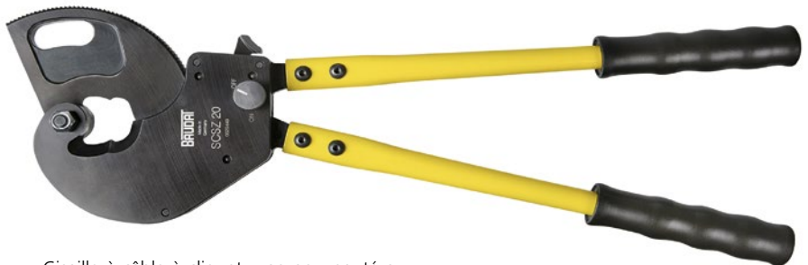
Cisaille à câble à cliquet, une nouveauté au catalogue de la boutique de l'EFS.

La collaboration avec La Poste Suisse se poursuit. La fiabilité de ce partenaire logistique de longue date, son implantation jusque dans les régions périphériques et ses livraisons assurées de façon impeccable justifient pleinement ce choix.