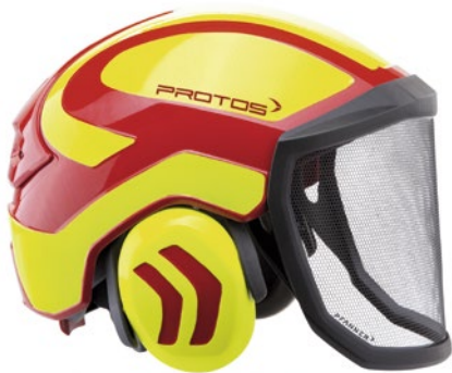
Le casque Protos est maintenant disponible.

Pour la première fois dans un casque forestier, tous les éléments sont intégrés à la coque. Il protège à la fois des chocs verticaux et horizontaux, que son système d'amortissement absorbe sans les transmettre à la tête ni à la colonne vertébrale. Pour diverses raisons, cet article s'est fait attendre longtemps et EFS-Shop est heureux de pouvoir enfin le livrer.