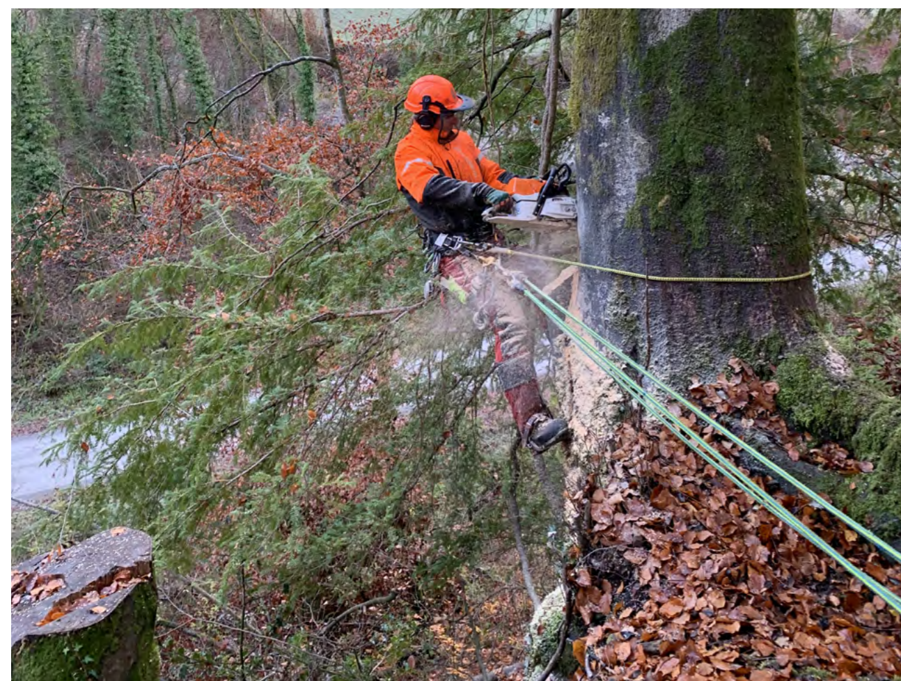
Assurance anti-chute lors de travaux en terrain escarpé pour un apprenti forestier-bûcheron lors d'un cours B à Alpnach (OW).