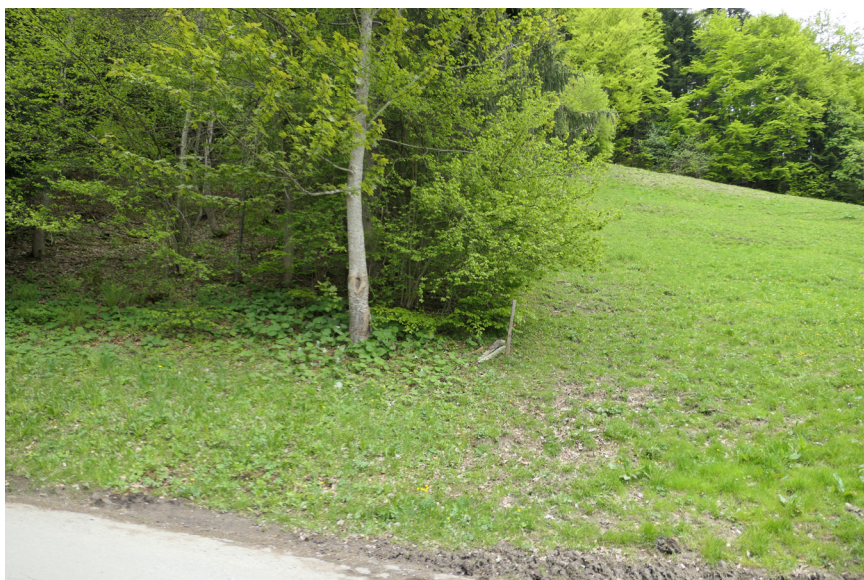
La limite de la forêt n'est pas partout aussi manifeste.

Dans les zones à bâtir, la plupart des cantons fixent une limite statique de la zone forestière. Les communes l'inscrivent sur leurs plans d'affectation.