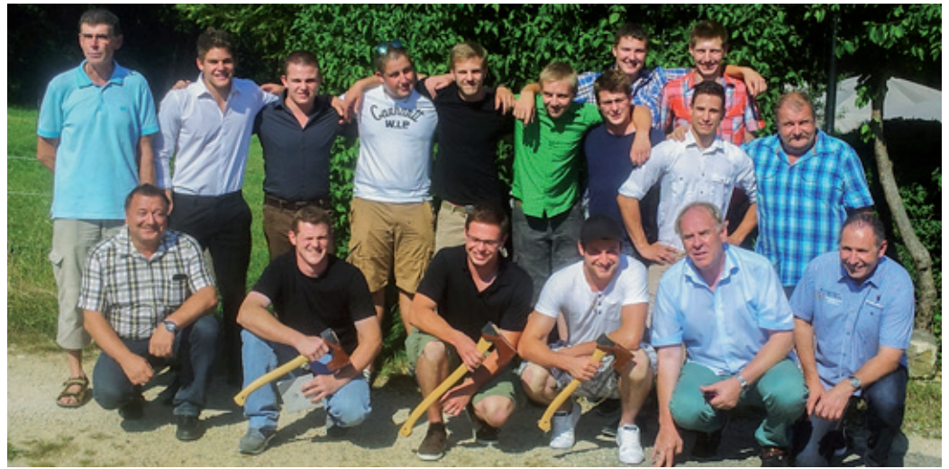
Die neuen Forstwarte stellen sich dem Fotografen mit ihren Lehrern und den Verantwortlichen der Oda Wald.

Am 1. Juli 2015 fand die Lehrabschlussfeier für Forstwarte EFZ statt. 12 Lernende aus den Kantonen Solothurn, Baselland und Baselstadt konnten an der Feier der Gewerblich-industriellen Berufsfachschule Liestal (GIBL) in Lausen die Fähigkeitszeugnisse entgegen nehmen.