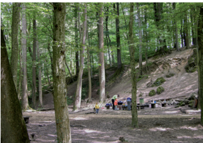
Feuerstellen resp. Rastplätze sind bei den Erholungssuchenden beliebt.

Beide. Zentral ist das offene Gespräch unter den Beteiligten. Bei uns war auf Seiten der Bürgergemeinde der Waldchef und der Revierförster eingebunden, auf Seiten der Gemeinde die zuständige Gemeinderätin und der zuständige Mitarbeiter der Verwaltung. Wertvoll war in den Verhandlungen, dass fundiert informiert wurde und, wenn nötig und sinnvoll vor Ort. Das erleichterte die Ausarbeitung der Leistungsvereinbarung wesentlich.