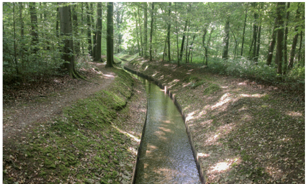
Der Wald erfüllt Aufgaben, die kaum wahrgenommen werden, aber für das Leben unverzichtbar sind. Dazu gehört die Produktion von Sauerstoff, die Reinigung der Luft von Staub oder die Aufnahme und Reinigung des Regenwassers, das als Trinkwasser genutzt wird.

Wir sind der Meinung, dass die heutigen gesetzlichen Rahmenbedingungen ein ökonomisches Bewirtschaften des Waldes durchaus ermöglichen.