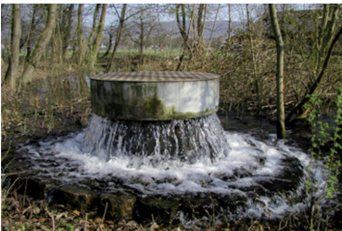
Gefiltertes Rheinwasser wird im Waldboden versickert.

Auf den trockenen Schotterböden des Lerchensporn-Hagebuchen-Mischwaldes wachsen vor allem Erlen, Traubenkirsche, Esche, Hagebuche, Eichen, Weiden, Pappeln, Ulmen und Spitzahorne. Früher wurden hier auch Hybridpappeln gepflanzt. Die sind riesig geworden und werden jetzt nach und nach entnommen, weil sie – wenn sie z.B. vom Sturm geworfen werden – grosse Wurzelkrater aufreissen, die den Versickerungsvorgang stören.