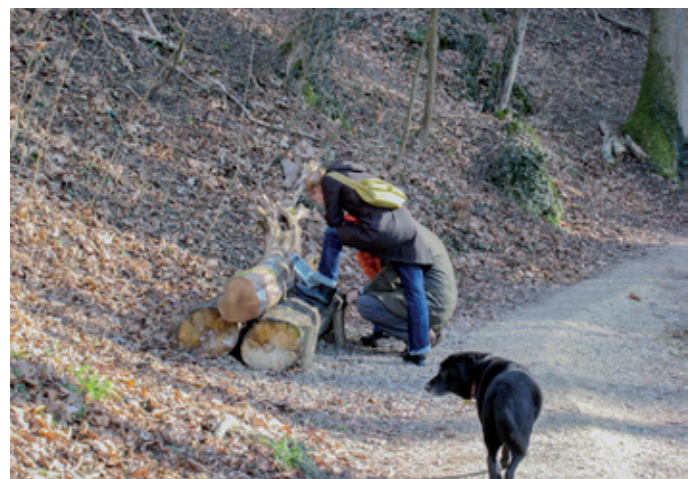
Informationen zum Wald bereichern den Besuch des Waldes.