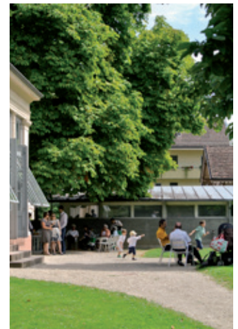
Beim Fällen von Bäumen in den Riehener Parks kommt das Team des Riehener Forstbetriebes zum Einsatz.

Das Forstteam besteht aus dem Revierförster, zwei Forstwarten und zwei Lehrlingen. Der Forstbetrieb ist örtlich und organisatorisch in die Werkdienste der Gemeinde Riehen integriert. Die-