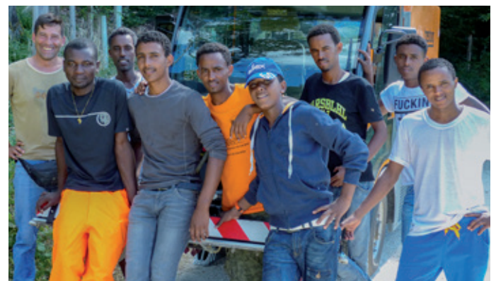
Die Asylsuchenden mit ihrem Betreuer nach dem Einsatz.