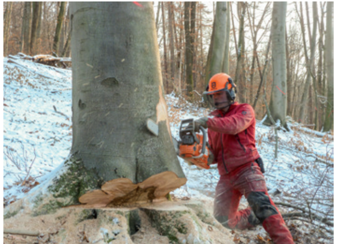
Die Lehrlingsausbildung gehört zu den Aufgaben des Forstbetriebes.