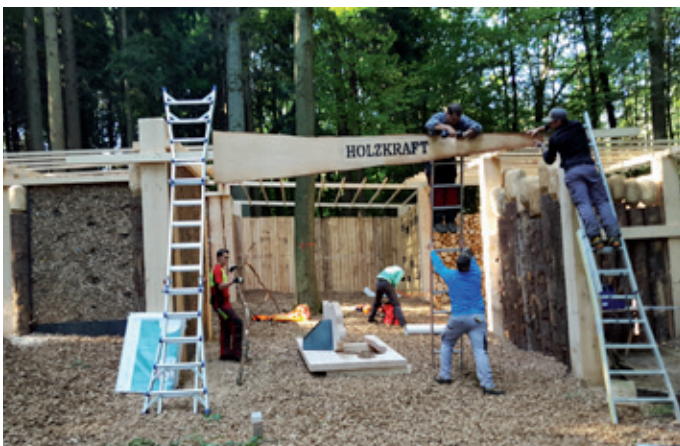
Kreative Zusammenarbeit der Forstteams der benachbarten Forstreviere «oberer Hauenstein» und «Hohwacht»