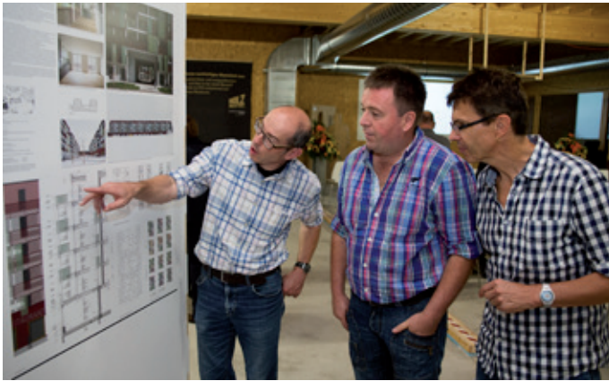
Angeregte Diskussion vor dem Siegerprojekt.