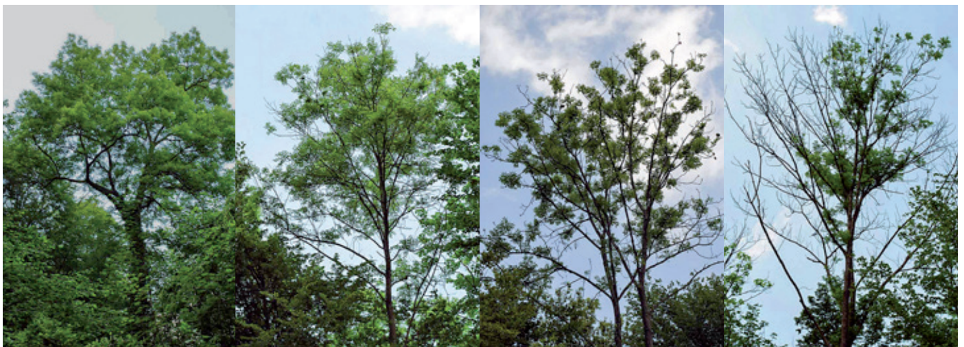
Verlauf des Zurücksterbens der Krone von vitalen Eschen im Verlauf mehrerer Jahre.