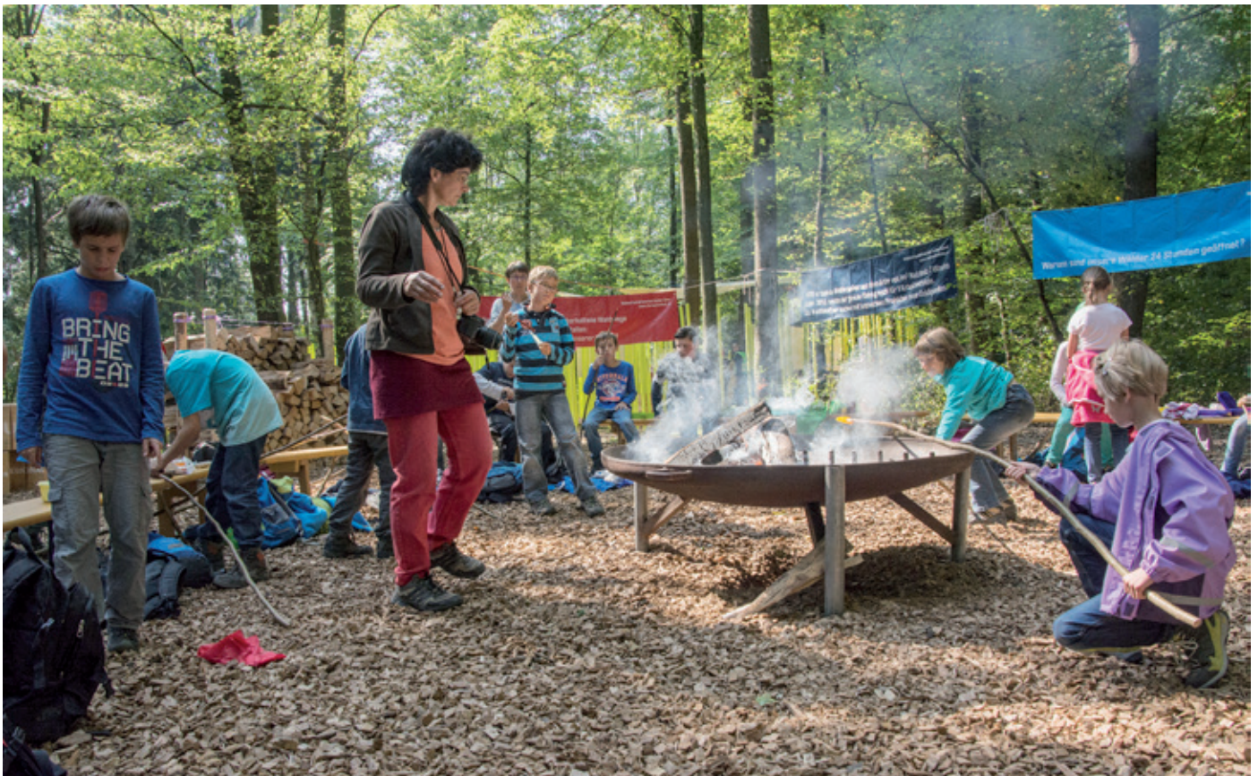
Schulkinder stärken sich an den Waldtagen bei der Feuerstelle des Waldwirtschaftsverbandes beider Basel