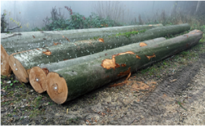
Buchensämme vor dem Abtransport.