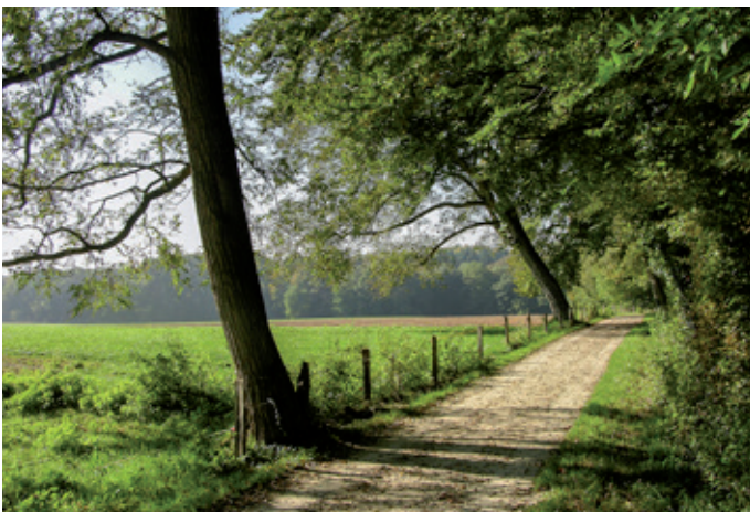
Sichere Waldwege für die erholungssuchenden Besucher des Waldes lösen Mehrkosten aus.

Auf den ersten Blick scheint ja alles geregelt zu sein. Weshalb kam es doch zum Abschluss einer Leistungsvereinbarung?