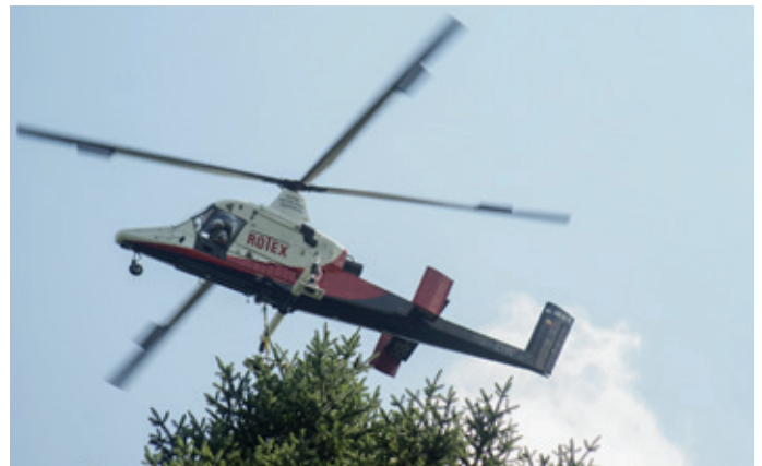
Der Kaman 1200 – K-Max beim Einfliegen.