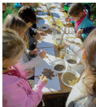
Malen mit Erde