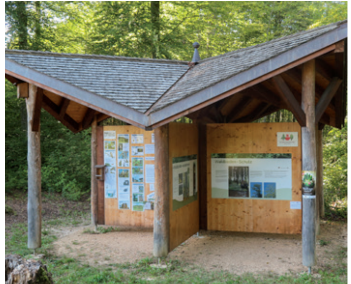
Eine neue Ausstellung wurde im Waldpavillon auf der Liestaler Sichertern eingerichtet, die bis kommenden Sommer dauert.

Mit den Bürgergemeinden setzt sich der Liestaler Bürgergemeindepräsident Peter Siegrist am Beispiel jener von Liestal in der dritten Präsentation auseinander. Der Waldpavillon befindet sich nahe beim Restaurant Sicherternhof, vor der Kreuzung, rechts am Waldrand. Die Ausstellung dauert bis zum Sommer 2016.