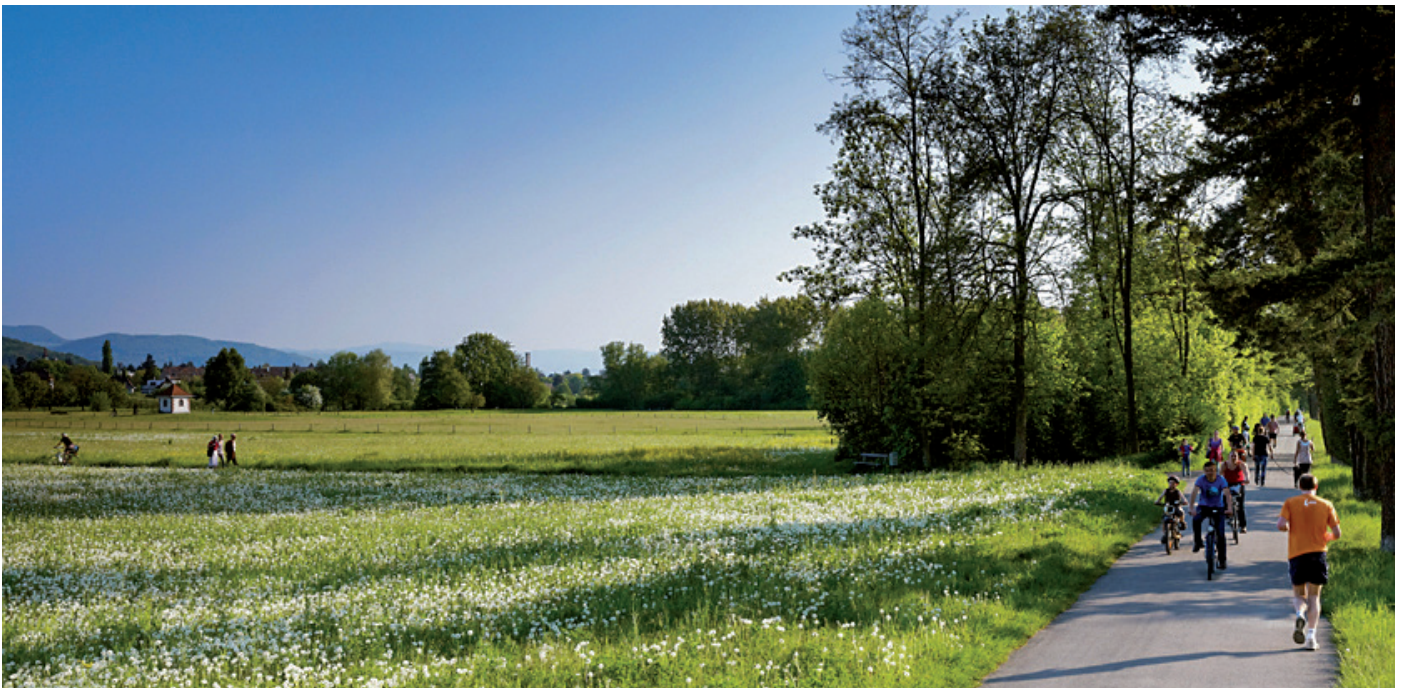
Die Erholungssuchenden und Sporttreibenden schätzen die nahen Felder und Wälder Riehens.