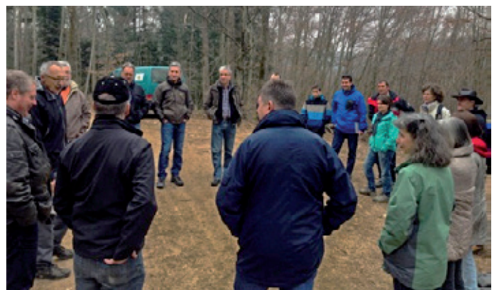
Gemeindevertreter werden über den vom Waldwirtschaftsverband beider Basel erarbeiteten Leistungskatalog informiert. Dabei wurde die Thematik in der Diskussion weiter vertieft.

*) Zitate aus dem vom Waldwirtschaftsverband beider Basel erarbeiteten Leistungskatalog