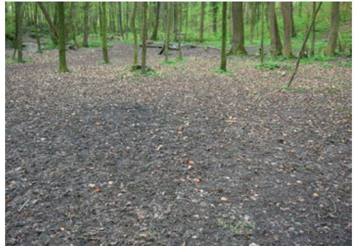
Sichtbare Folgen einer intensiven Freizeitnutzung im Binninger Wald.

Wie haben Sie die Leistungsvereinbarung ausgearbeitet?