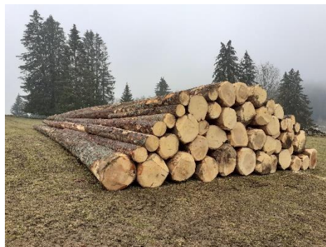
Lot de grumes résineuses

L'état sanitaire (bostryche, dépérissement) des résineux a été satisfaisant en Suisse suite à un été frais et humide. En revanche, en France voisine, la crise du scolyte perdure et les résineux martelés sont très nombreux ; les stocks de bois sur pied et à port camion sont encore élevés, au contraire de la Suisse où les stocks de bois sont très bas.