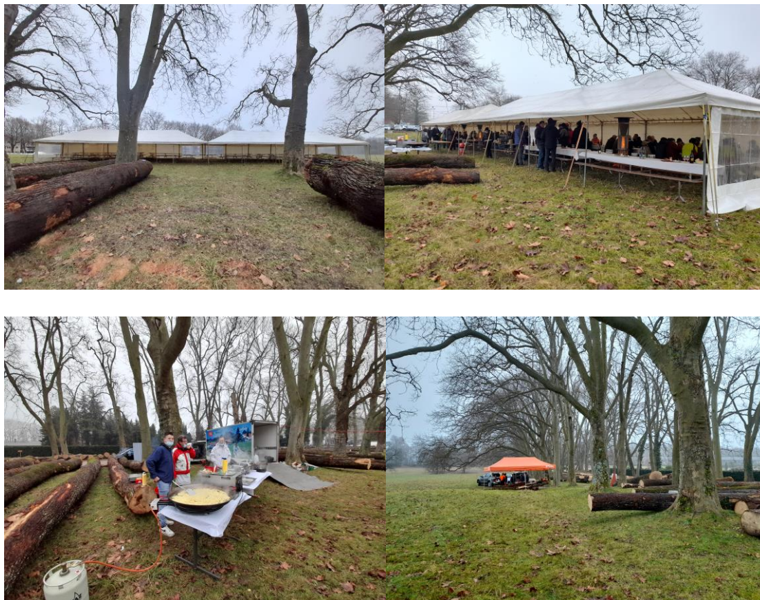
Cantines et cuisine de campagne dressées à l'occasion de la vente des bois précieux.

Suite à la vente du 15 décembre et pour marquer le jubilé du 100ème anniversaire, un repas chasse s'est tenu, avec un civet de cerf façon « grand-mère », auquel notre association a souhaité réunir toute la filière forêt-bois (propriétaires, ingénieurs, gardes, forestiers-bûcherons, apprentis, stagiaires, débardeurs, entreprises forestières, scieurs).