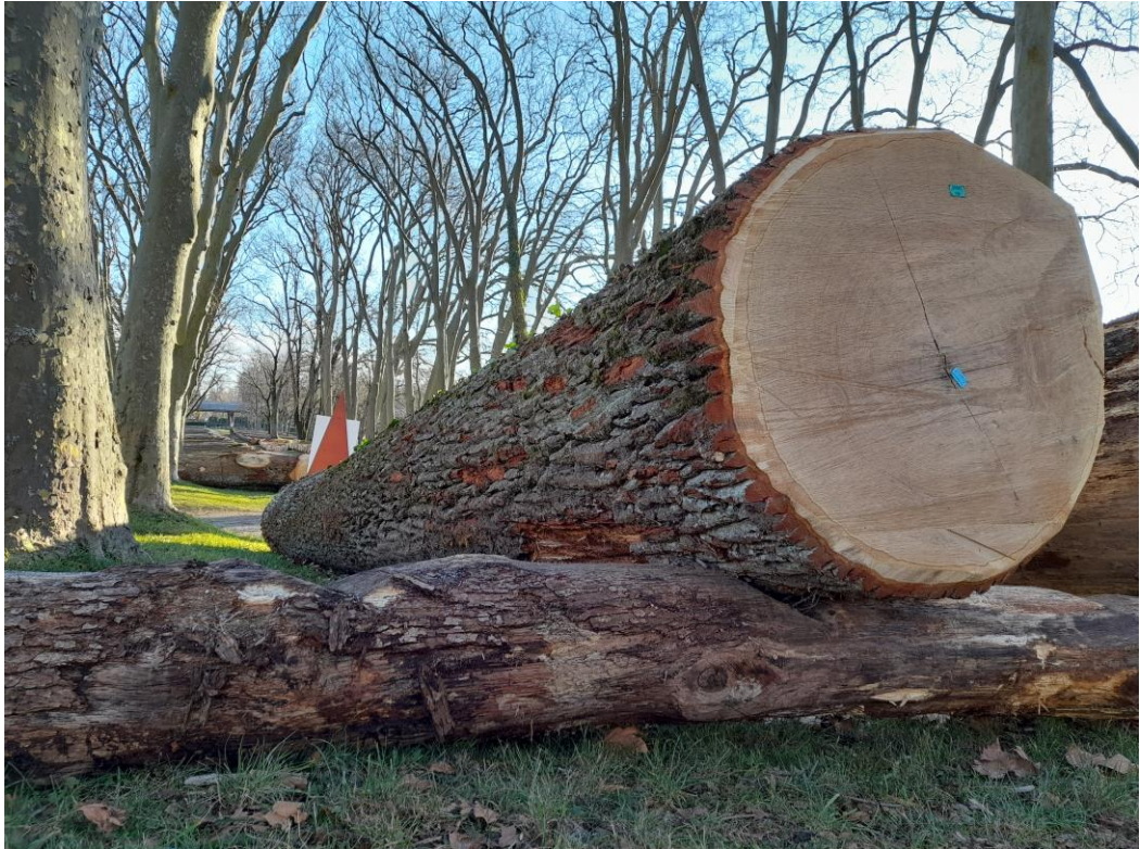
Chêne exceptionnel de 5.78m 3 ayant obtenu le meilleur prix de tous les chênes avec frs 2'002.-/m 3 pour un prix totalisant 11'572.- frs.