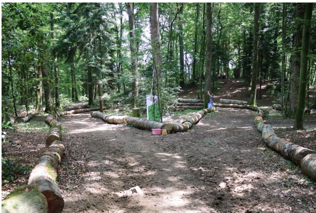
Le cadre du défilé de mode en forêt de Charcottet, Bevaix.

Cet évènement a vu défiler 22 mannequins portant des créations avec des tissus fabriqués à base de bois. En effet, il existe des tissus issus à