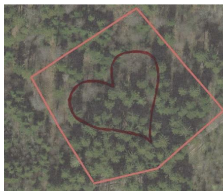
Plan de la surface.

Les propriétaires forestiers neuchâtelois, ainsi que la population du canton, ont un lien très fort avec leurs forêts. C'est pourquoi, pour marquer son centenaire, ForêtNeuchâtel a décidé de planter, avec la participation de neuf classes d'école, une surface ravagée par la tempête Ciara du 10 février 2020, en forme de cœur. Cette plantation a été soutenue par le Service de la faune, des forêts et de la nature et s'est effectuée en accord avec les milieux de protection de la nature. Le cœur, piqueté par un géomètre, sera ainsi visible du ciel ou sur les photos aériennes durant des décennies, rappelant le centenaire et illustrant l'attachement des neuchâtelois envers leurs forêts.