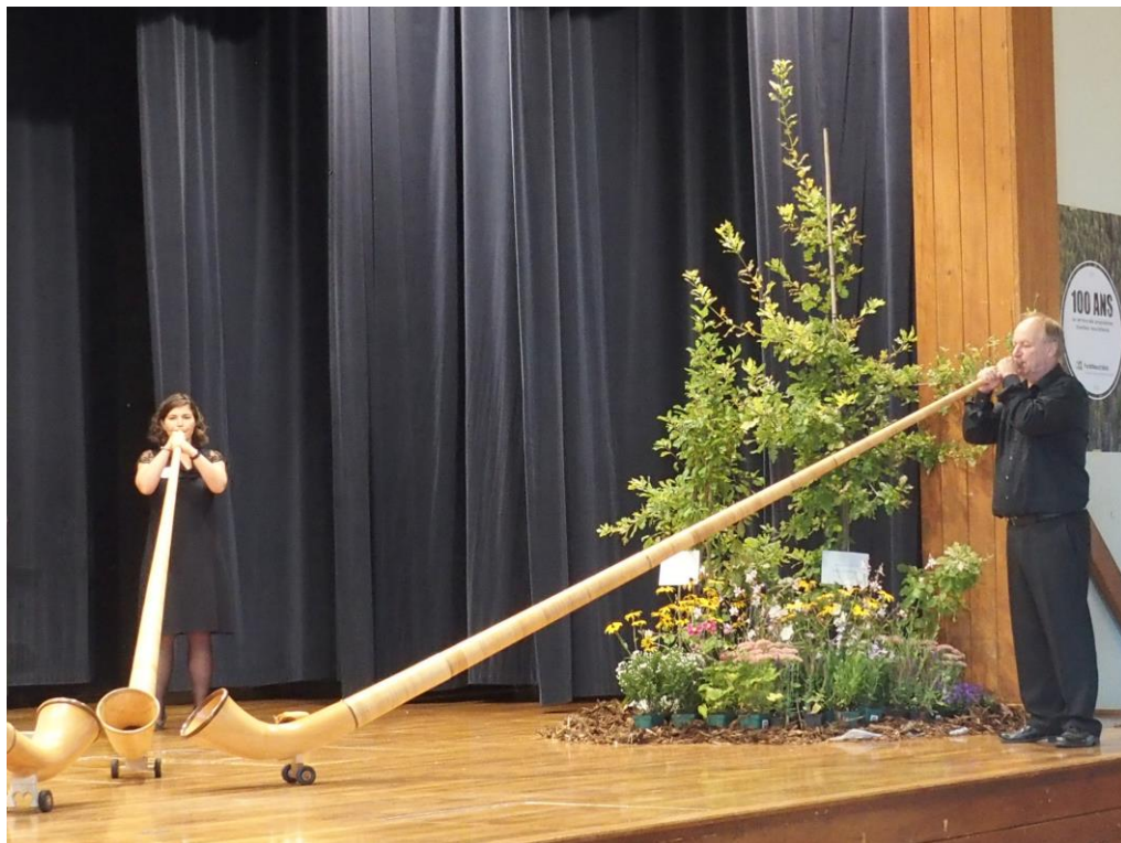
Dacor, quatuor de cors des Alpes, lors de l'assemblée générale.