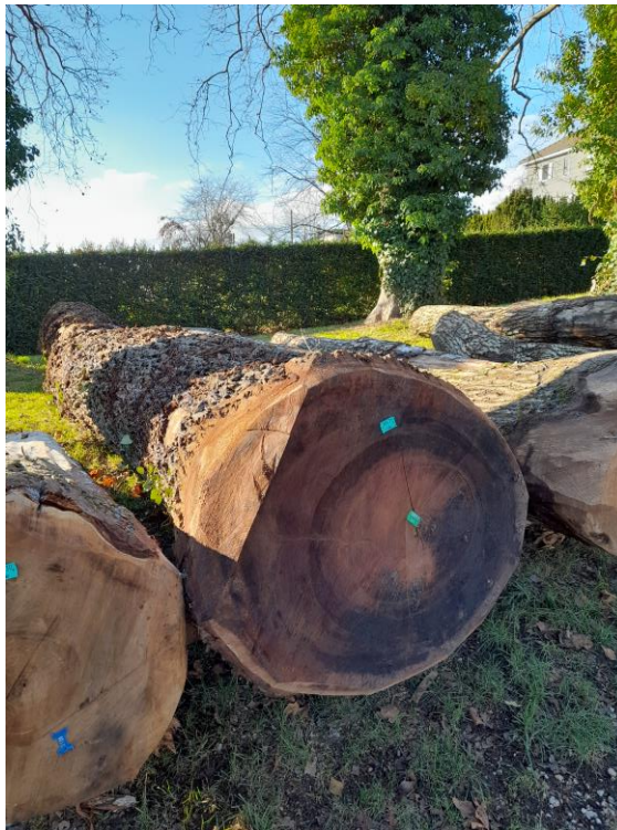
Un rare noyer noir de 2.92m 3 vendu au prix de frs 1'458.-/m 3 pour un prix total de 4'257.- frs.