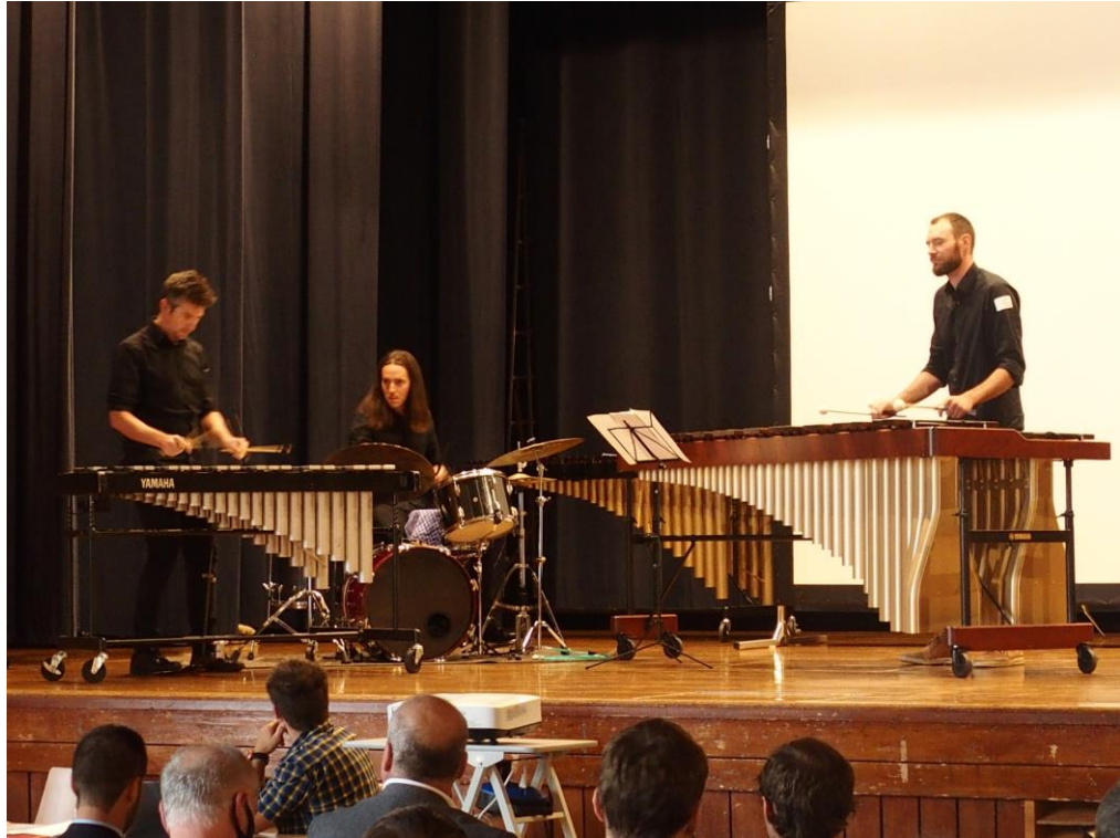
Senior Mouse Trio, ensemble de percussion.