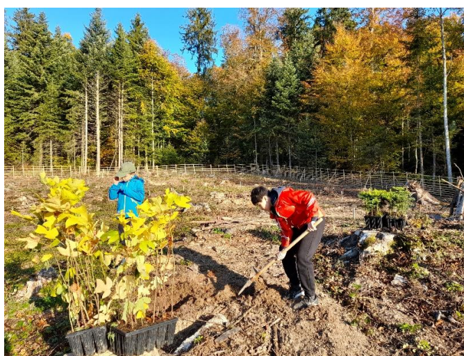
Elèves du collège des Safrières de Corcelles-Cormondrèche en train de planter des tulipiers de Virginie.

La surface est temporairement clôturée afin de limiter les dégâts du gibier sur les jeunes plants.